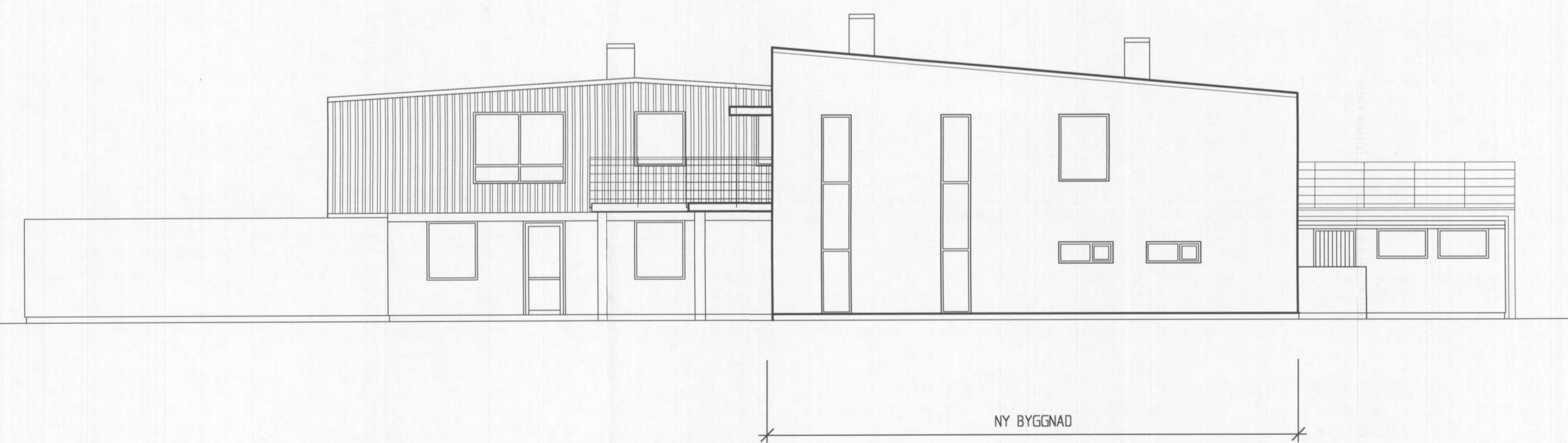
FASAD MOT SÖDER 1:100