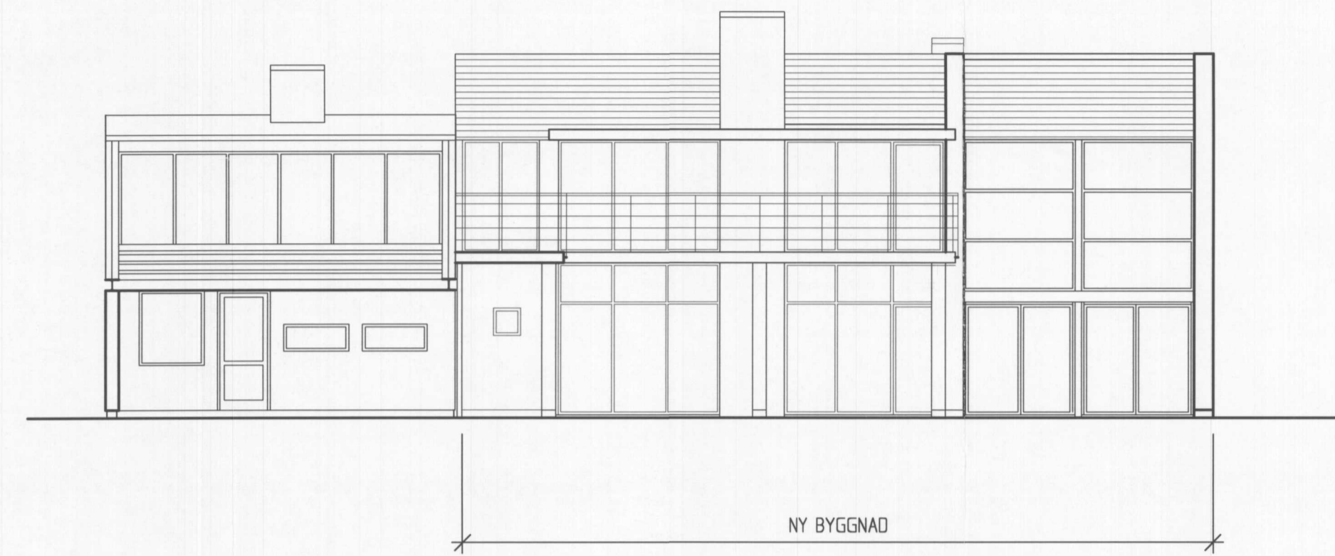
FASAD MOT VÄSTER 1:100